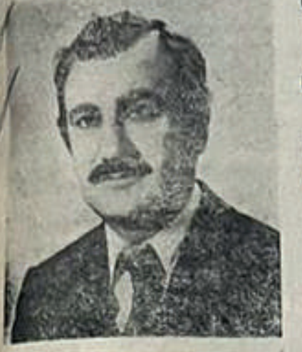
GERZE (Özel) — Gazete...

çıkılarak ilk taramayı Osman Yılmaz mahalleli Gece koolu bölgesindeki Orhan Gaz il okulunda başladı.